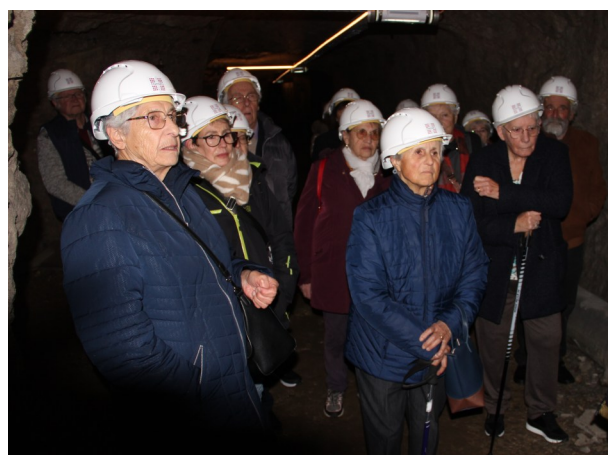
Visite de l'abri antiaérien Nézin à Chambéry