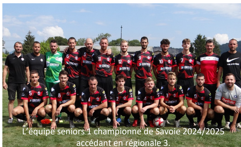
L'équipe seniors 1 championne de Savoie 2024/2025 accédant en régionale 3.