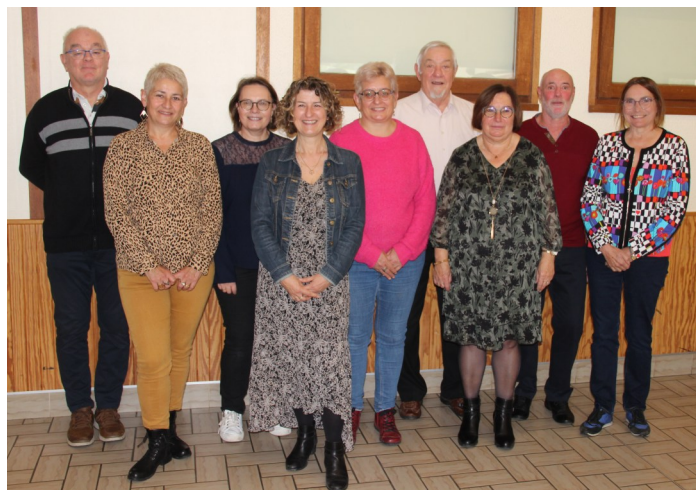
Les membres du CCAS

Nous vous espérons encore nombreux cette année pour ce repas festif.