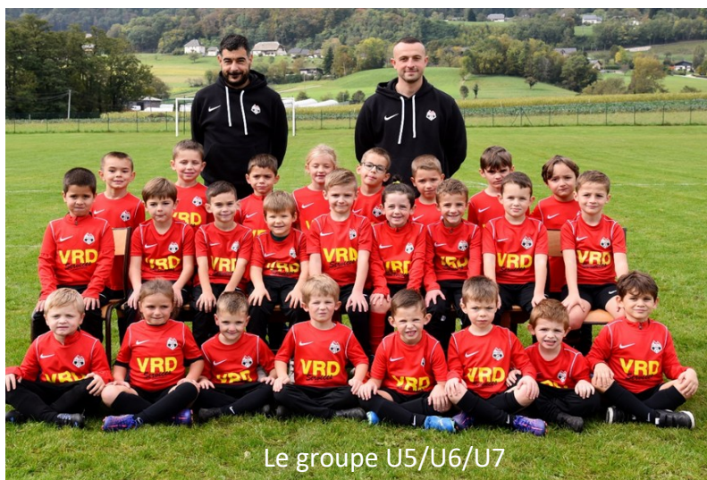
Le groupe U5/U6/U7

En juin, la pluie nous contraint de reporter le concours de pétanque du Val d'Hyères au 13 septembre 2025 sur le stabilisé de Vimines.