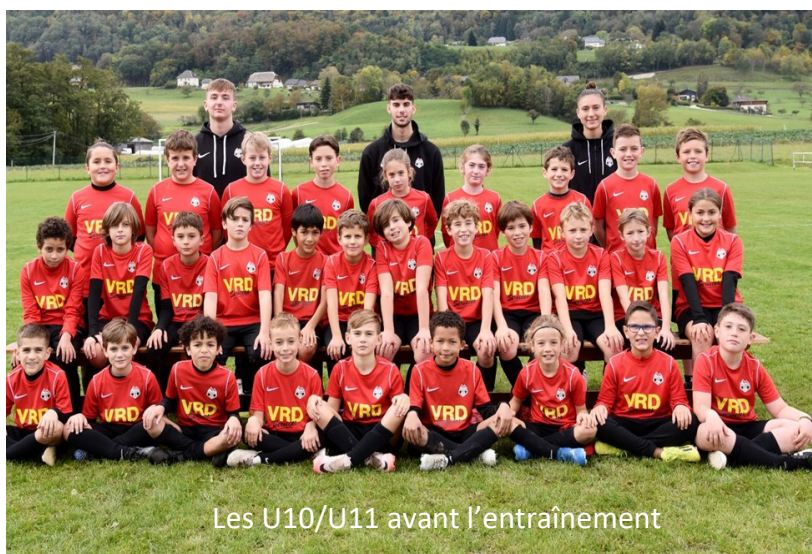
Les U10/U11 avant l'entraînement