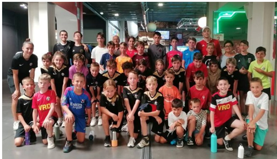
Séance bowling au stage de juillet 2025