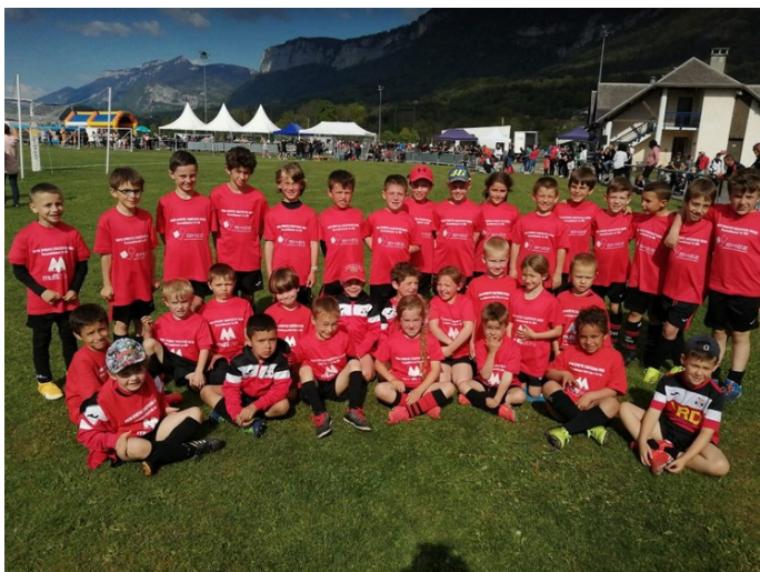
Les U8/U9 en tournoi à St Laurent du Pont.